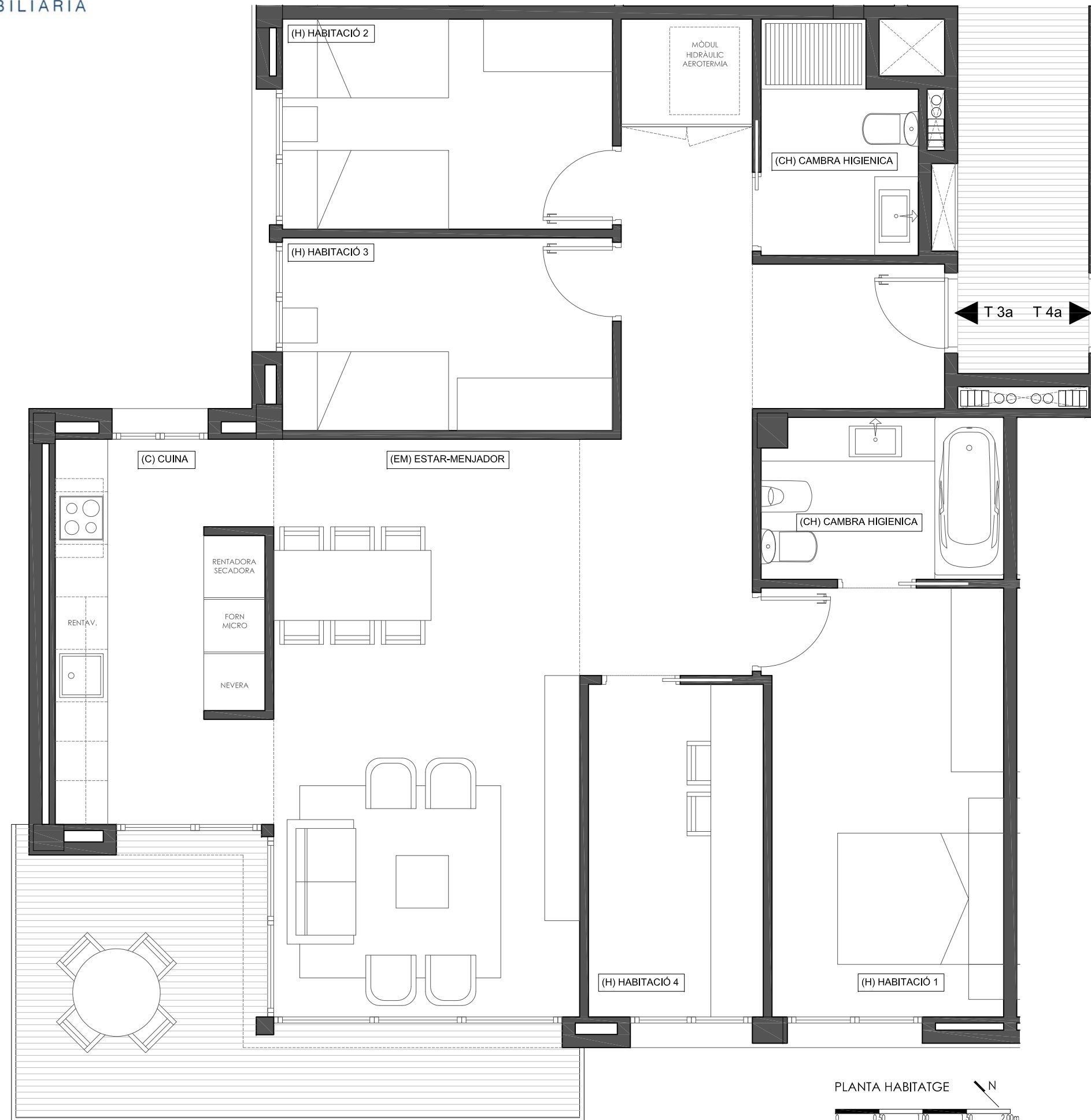
PLANTA HABITATGE 0 0,50 1,00 1,50 2,00m